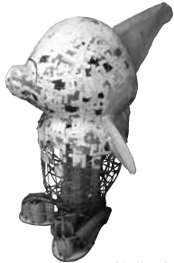
グランパス君(製作中)

どの教室からも豊田スタジアムを見ることが出来ます。秋にはコスモスの絨毯に目を奪われます。スーパーイングリッシュハブスクールの指定を受けています。これから新しいものが付け加わります。同窓生の皆様の期待に応えるのが私の使命です。