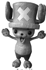
チョッパー (北高事務室前に展示)